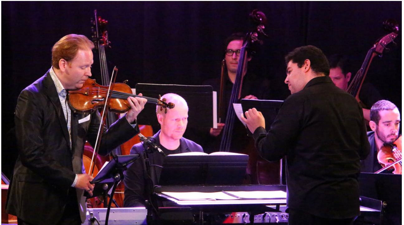
Ensemble LPR: From left, Daniel Hope, Max Richter and the conductor Tito Muñoz in a “recomposition” of Vivaldi’s ubiquitous “Four Seasons,” at Le Poisson Rouge – december 2012.