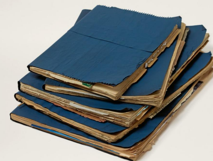
MAX RICHTER The Blue Notebooks

albums noir de noir des génies new-yorkais du gangsta rap, et les incursions du Bowie période allemande dans le théâtre de Brecht... Chaque vendredi, retrouvez le meilleur de l'actualité vinyle sélectionné par 180 gr, et cette semaine, le disquaire The Message, à Troyes.